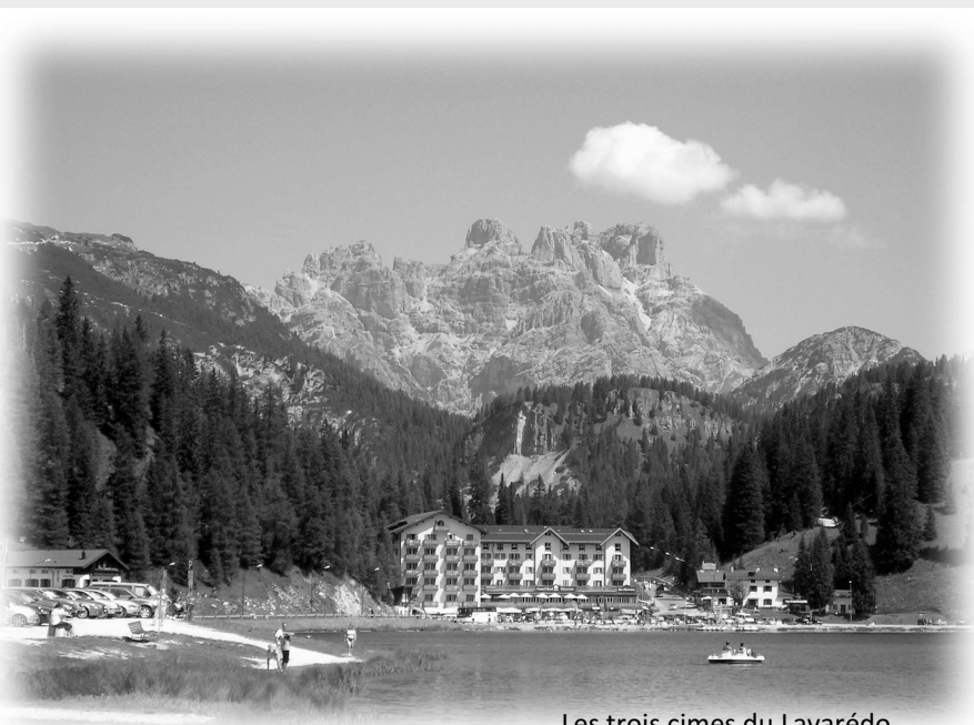
Les trois cimes du Lavarédo

Le circuit par les cols du Pordoï, Sella, Gardena, Valparola, Falzarego est une mise en jambe qui prépare mentalement aux jours à venir.