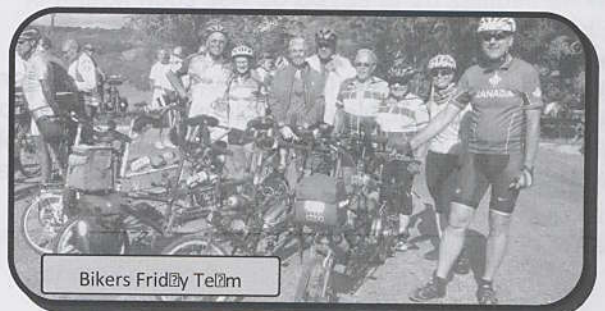
Bikers Friday Team

Le calendrier des rencontres tandem 2014 Page 26 et 27