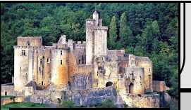
Château de Bonaquil

Dimanche 12/05 09h00 départ groupé pour visite du site de Bonaquil (25 à 30 km environ). 13h00: fin de la manifestation