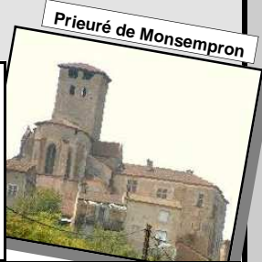
Priuré de Monsempron

Jeudi 09/05: Accueil à partir de 10h. 14h30 – départ pour une sortie groupée d'environ 40 à 45 km à allure modérée. Thème : Coup d'Œil sur le Lot. 17h00: dégustation de Cahors