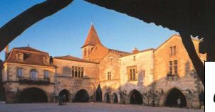
Monpazier – BCN/BPF – 24

Samedi 11/05 Heure de départ libre pour une rando d'environ 80km sur la journée - repas tiré du sac - Thème : Châteaux et bastides 20 h00: Repas de groupe